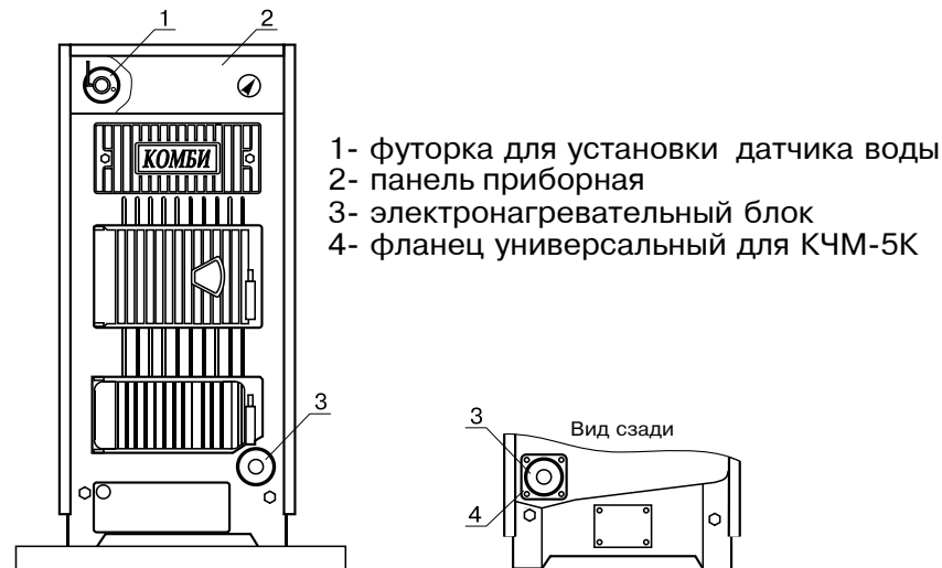
Рис.1 Установка электронагревательного блока на котле.

Блок нагревательных элементов состоит из трех ТЭНов, имеющих общий фланец с резьбой G2-В и защитного колпака с сальником. В корпус фланца установлен датчик обратной воды. Провода от нагревательных элементов и датчика проходят через сальник и фиксируются в нем. Блок нагревательных элементов (3) закручивается в универсальный фланец для КЧМ (4) через уплотнительную прокладку. Фланец устанавливается вместо заглушки на обратном трубопроводе сзади котла. Если расположение котла не позволяет установить ТЭНБ сзади, то возможна установка спереди котла, вместо заглушки у шуровочной дверцы. Датчик прямой воды устанавливается в футорку (1), которая служит также для установки тягорегулятора.